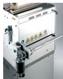
Récupération automatique du déchet de film sur BARQ' OVG