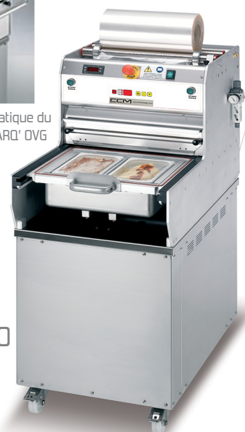
BARQ' OVG 40 BARQ' OVG 220